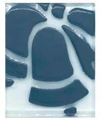
AZUL MARINO 15