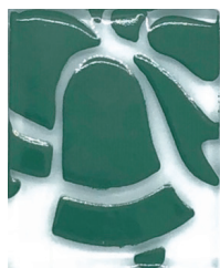
VERDE CROMO 08

Pasta de vidrio apto para aplicar con grandes espesores por medio de una espátula o utilizando un stencil.