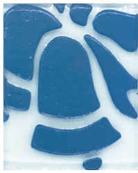
AZUL ELÉCTRICO 05