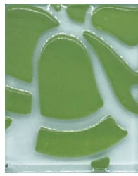
VERDE MANZANA 06