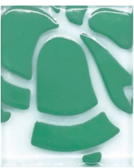
VERDE CLARO 07