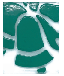
VERDE CESPED 16