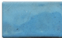
TURQUESA CLARO 6326