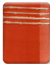
NARANJA CD 2868