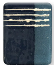
AZUL ULTRAMAR 2854