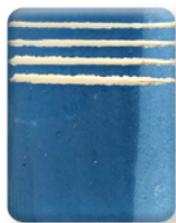
AZUL FRANCIA 2839