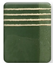
VERDE MUSGO 2846