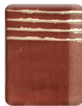
MARRÓN ROJIZO 2852