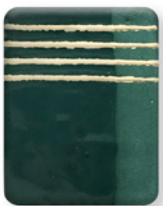
VERDE PETRÓLEO 2838

Son libres de plomo. Se pueden aplicar sobre crudo o bizcocho cerámico, luego cocinar a 1020° - 1040° C . Si se desea, en otra cocción se le puede aplicar una cubierta transparente y volver a cocinar a la temperatura indicada para la misma. Como máximo 1200°. Este engobe está preparado con una viscosidad elevada, se puede acondicionar agregando agua en la cantidad necesaria para adecuarlo según el uso.