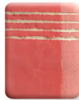
ROSA INTENSO 2885