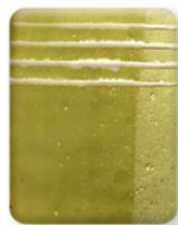
VERDE PISTACHO 2872