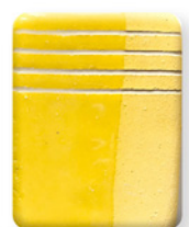
AMARILLO CD 2859