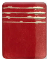
ROJO CD 2866