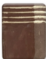
MARRÓN CHOCOLATE 2856