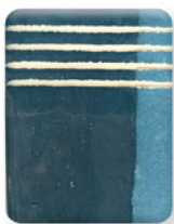
AZUL COBALTO 2848