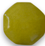
AMARILLO LIMÓN 6708