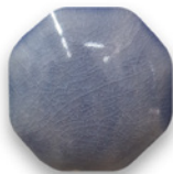
AZUL LAVANDA 6724