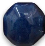
AZUL PETRÓLEO 6726