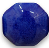
AZUL COBALTO 6728