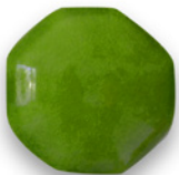
VERDE CLARO 6723